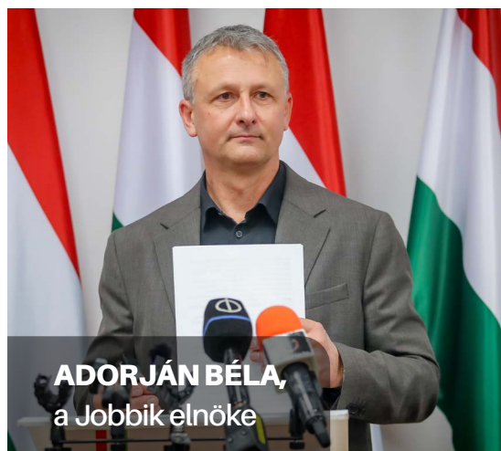
ADORJÁN BÉLA, a Jobbik elnöke

Ízlelgezzük egy picit: a magát a „vidék kormányának” nevező,