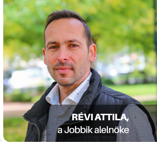
RÉVI ATTILA, a Jobbik alelnöke

A Covid-19 járvánnyal és az elhibázott járványkezeléssel való szembenézés számunkra azt is jelenti, hogy azoknak, akiket igazságtalanul hátrány és kár ért, azoknak kárát tegye jóvá a kormány és kérjen tőlük bocsánatot.