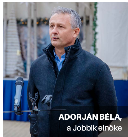
ADORJÁN BÉLA, a Jobbik elnöke

Ezért döntöttünk úgy, hogy a Jobbik önállóan indul a 2026-os országgyűlési választásokon. Hisszük, hogy Magyarországnak szüksége van egy olyan erőre, amely kérlelhetetlen következetességgel áll ki az igazi változás mellett.